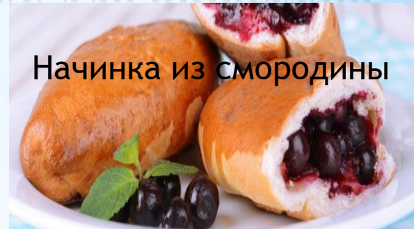
Начинка из смородины