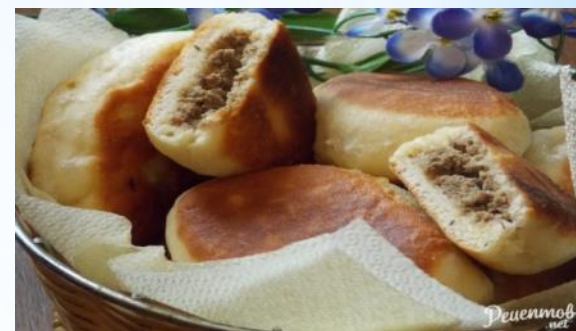
Начинка из печени