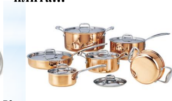
Кастрюли различного объёма