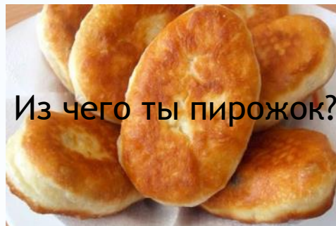
Из чего ты пирожок?