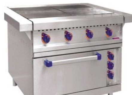
Оборудование – печь, плита...