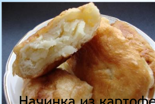
Начинка из картофеля