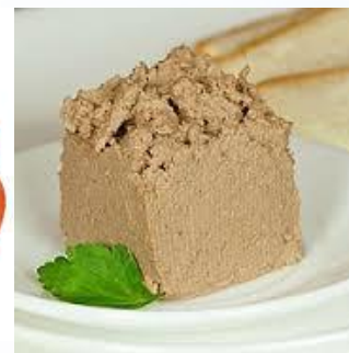
Паштет из печени