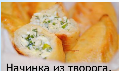
Начинка из творога, яйца и зелени