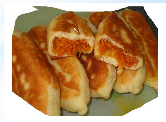
Начинка из моркови