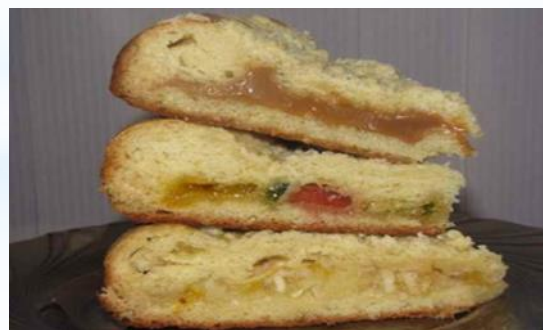
Начинка из различных видов повидла